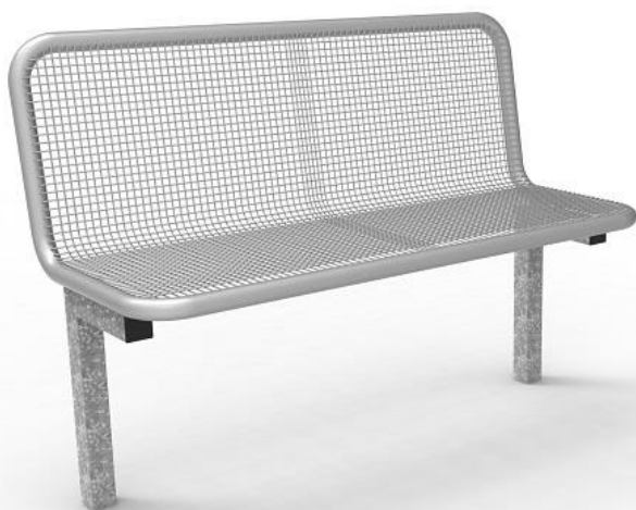
Variante zur ortsfesten Aufstellung in Fundament

Leienfelsstrasse 1 81243 München Tel.: 089 - 89 77 77 - 0 Fax: 089 - 89 77 77 - 77 Mail: info@stroebl.com